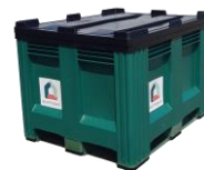
Schéma 1 – À déposer dans les caisses palettes : Objets de la maison – 80cm