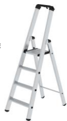
Escabeau et échelle