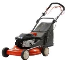
Tondeuse électrique ou thermique