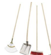
Râteau et pelle