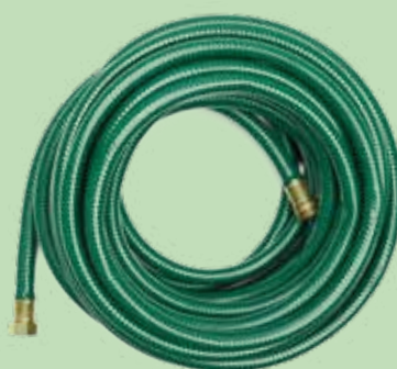
Entretien du jardin