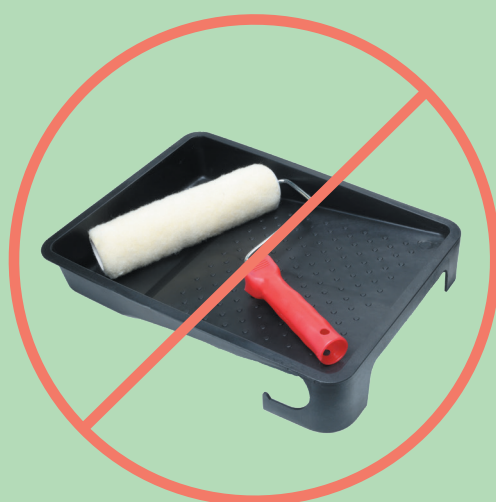
Outil de peinture