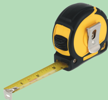
Outil de mesure et de traçage