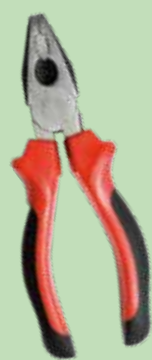
Outillage à main