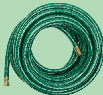
Entretien du jardin