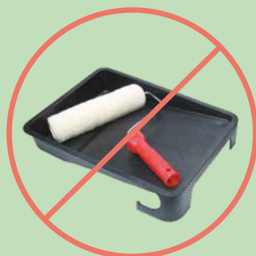
Outil de peinture