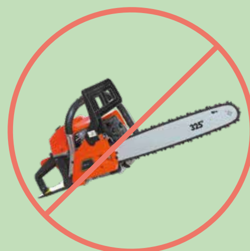
Outil thermique/ électrique