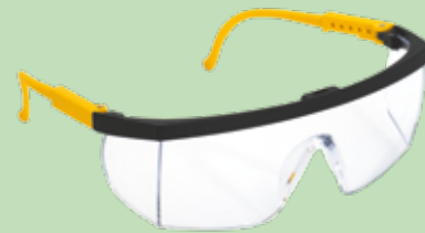
Protection du bricoleur