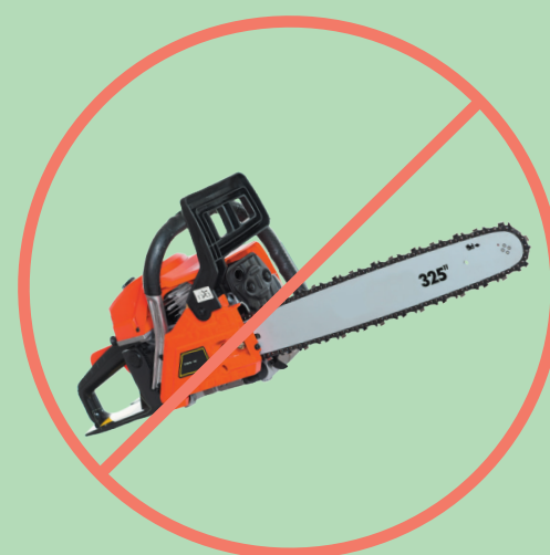
Outil thermique/ électrique