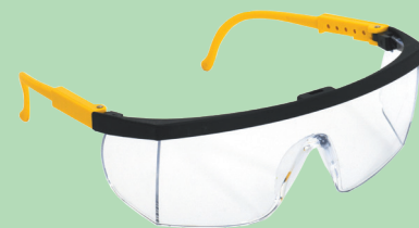
Protection du bricoleur