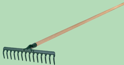
Outil du jardin