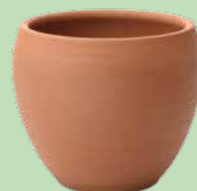
Jardinière et pot de fleurs