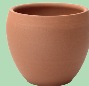
Jardinière et pot de fleurs