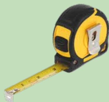
Outil de mesure et de traçage