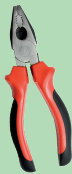
Outillage à main