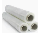
Éléments de palettisation