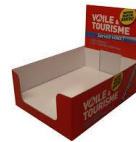
PLV ayant une fonction d'emballage