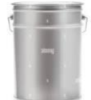
fût, jerrican, seau plus de 29 L